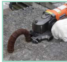
不要な鉄筋をツラで切断