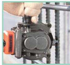
開口部をツラで切断