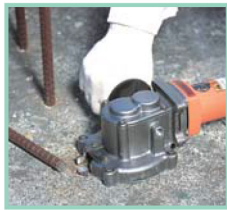
差し筋をツラで切断