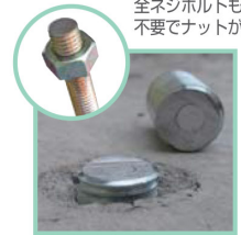
全ネジボルトもバリ取り 不要でナットが入ります