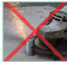
火花も少なくきれいで早く