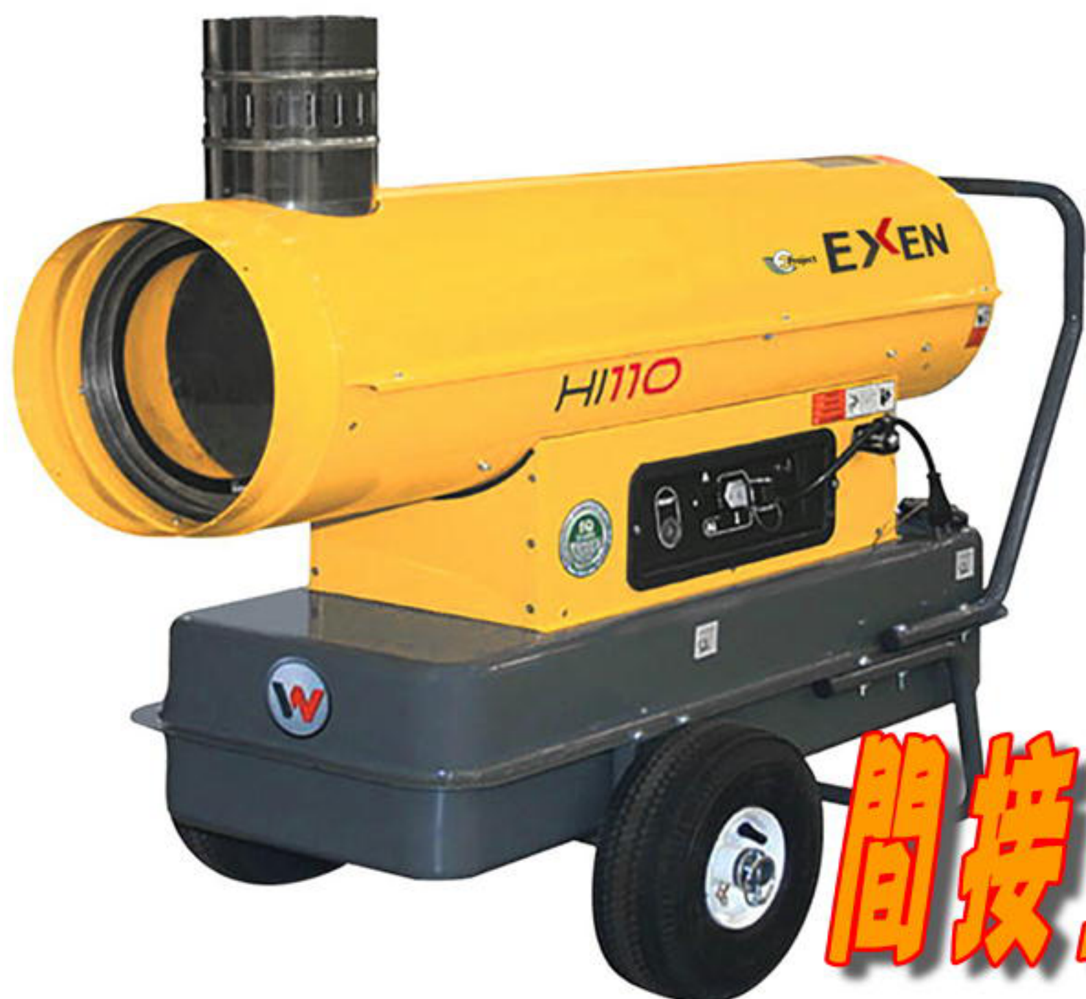
インダイレクトヒーターの仕組み

建設現場の各種養生、コンクリートの養生、凍結防止、仮設・災害時の暖房、各種乾燥用としてご利用できます。