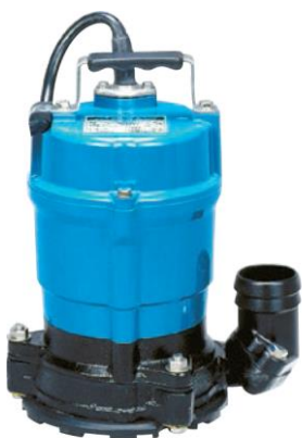
HSR2.4S ベブリースーパー